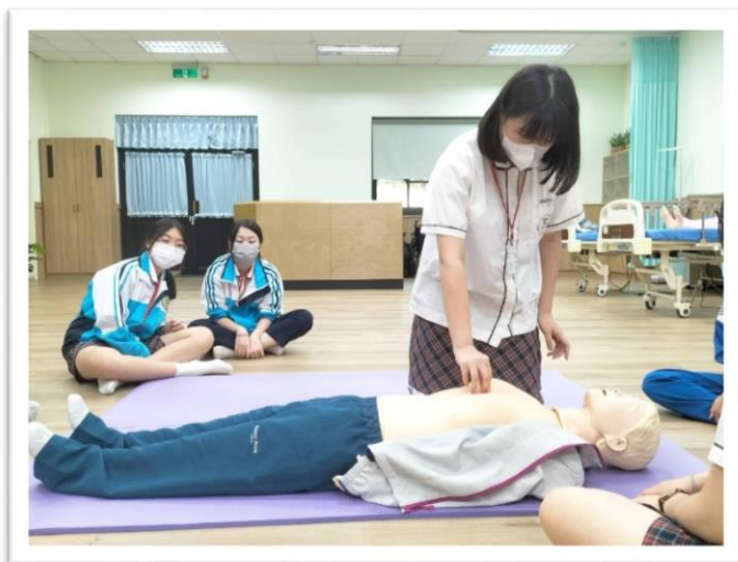
心肺復甦進行練習