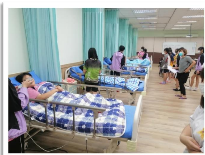
高齡居家環境安全護理