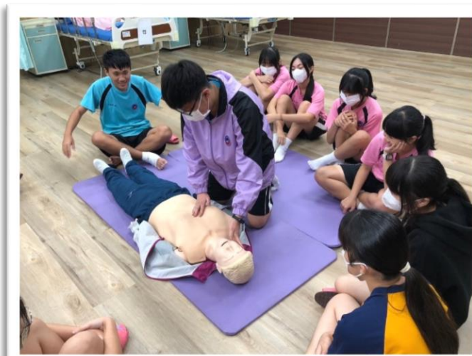
心肺復甦技術練習