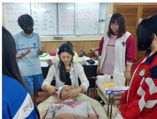
臉部按摩技巧與實作