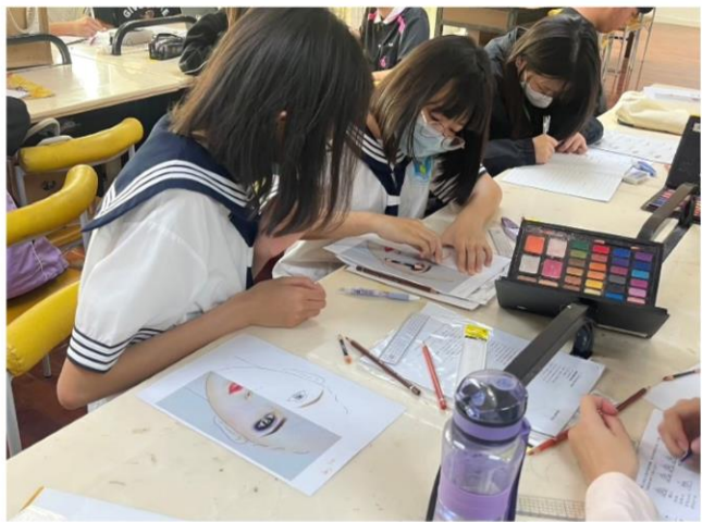
紙上化妝進階四季彩妆女系練習